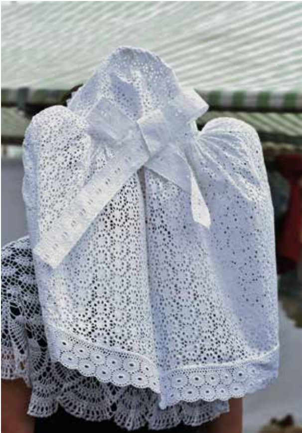
Dat is ongerimpelde witte broderie/feston of kloskant.