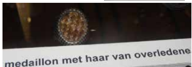
medaillon met haar van overledene

De drachten met lange mutsen 'uit de rouw' De 'lange mutsendraagsters' kwamen oorspronkelijk van de eilanden: Tholen, Sint Philipsland, Schouwen, Duiveland, Noord-Beveland en van de Zuid-hollandse Eilanden. De krullen, mutsenbellen en -spelden verschilden van eiland tot eiland, evenals de haardracht en ook het opzetten van de muts. Bekend is dat op Schouwen de muts gemaakt werd met de naad op het voorhoofd en verwerkt werd in een